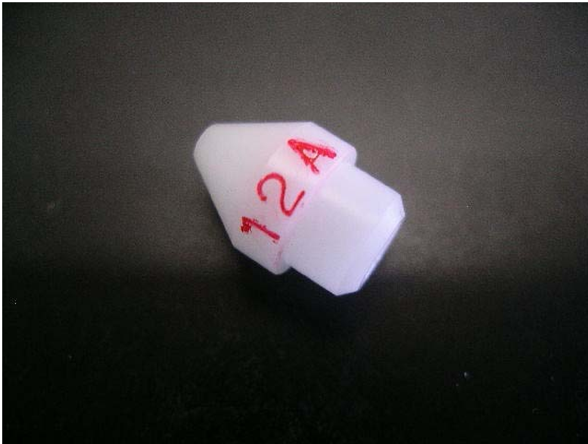
No.4962 材質:ジルコン 外径:10 全長:14.5 処理:生地