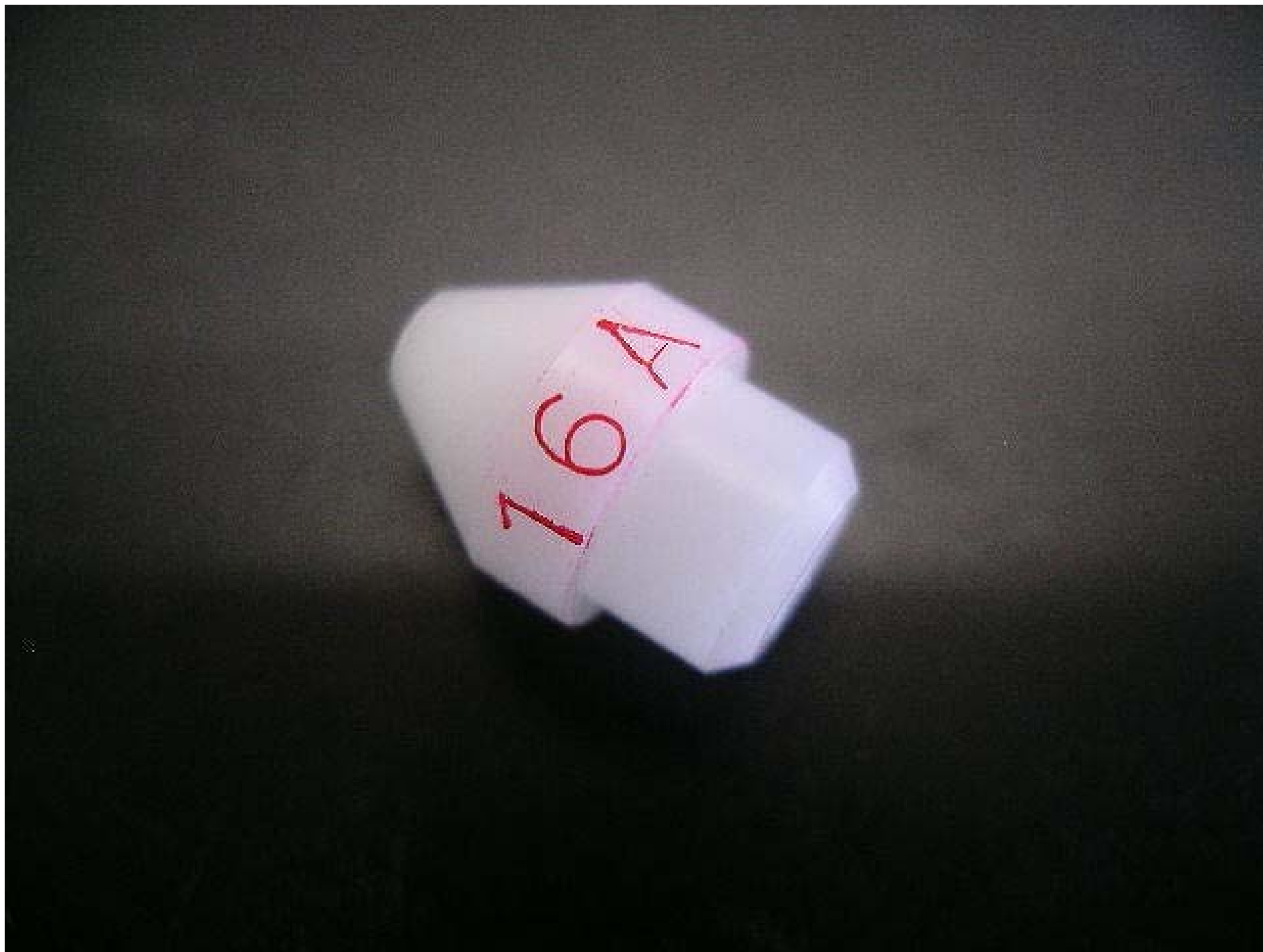
No.4948 材質:ジュラコン 外径:10 全長:14 処理:生地