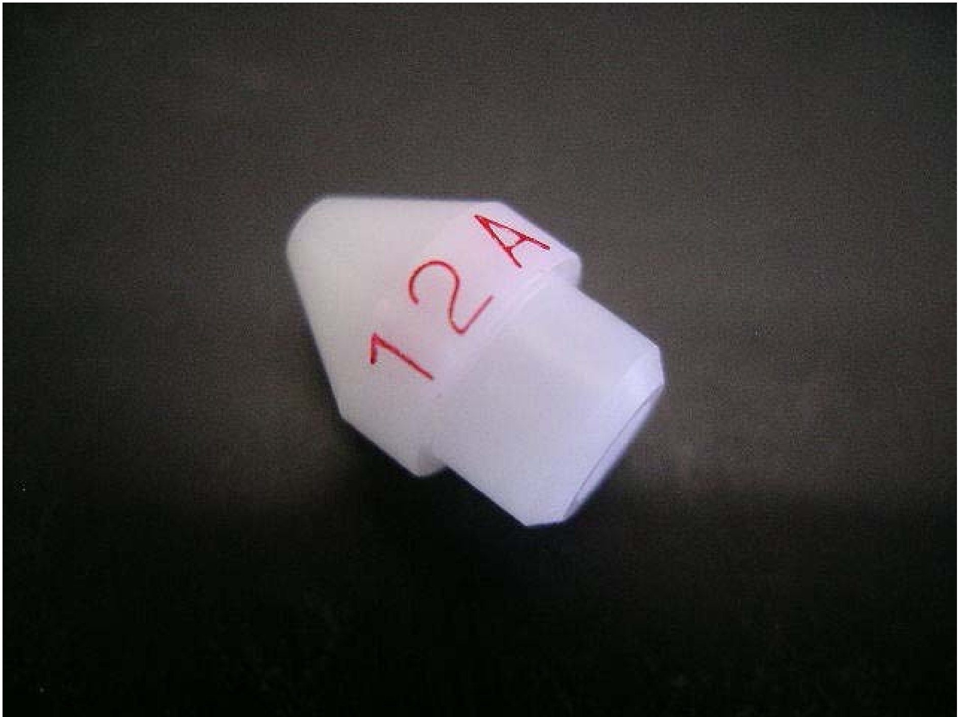
No.9156 材質:ジュラコン 外径:10 全長:14.5 処理:生地