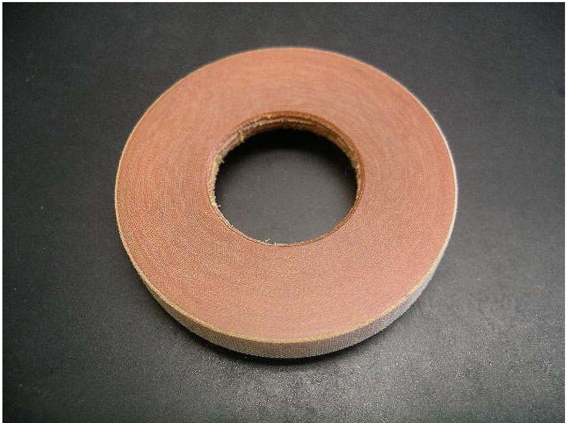
No.4586 材質:布入りペーク 外径:45 全長:7 処理:生地