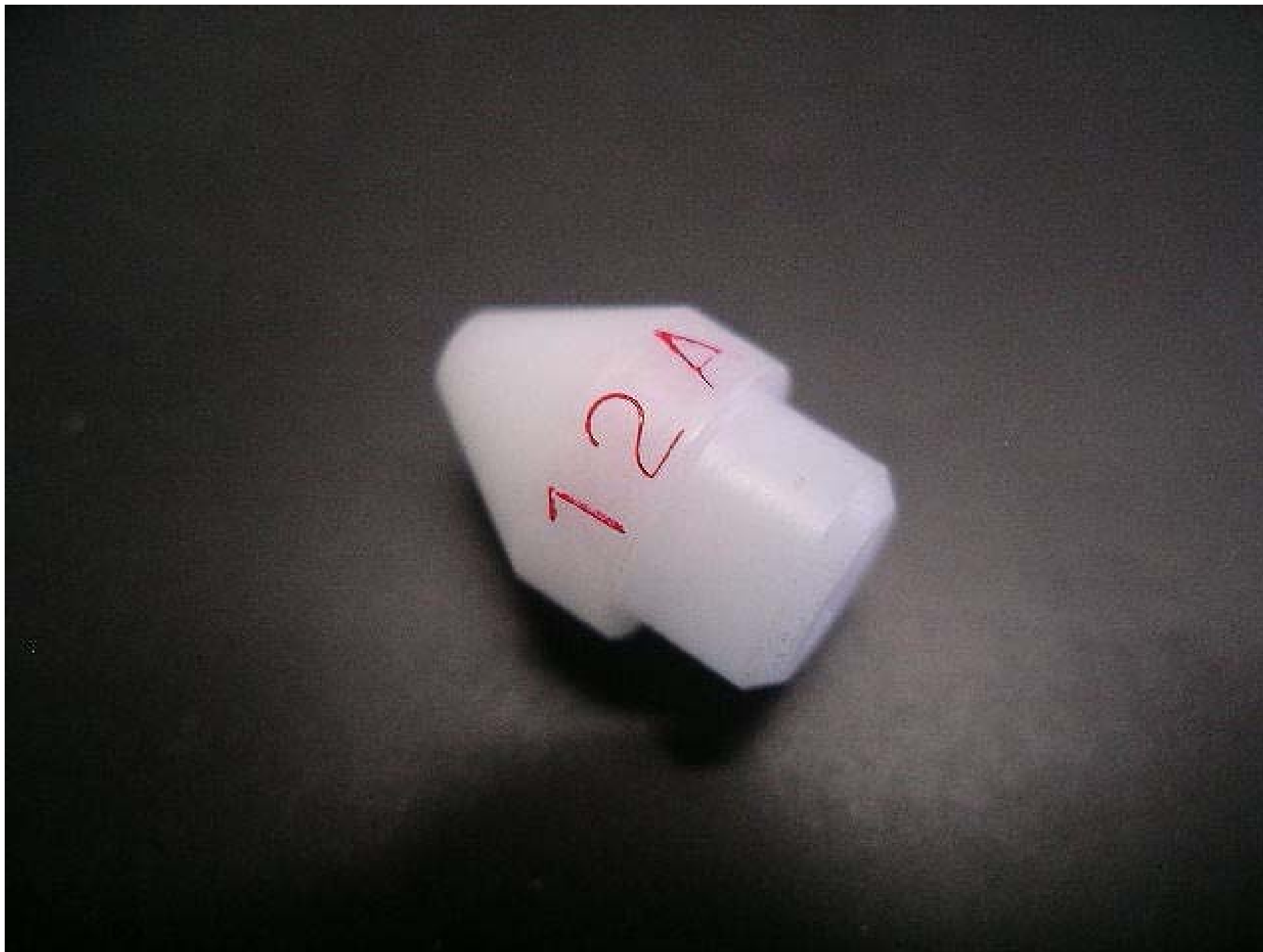
No.9158 材質:ジユラコン 外径:10 全長:14.5 処理:生地