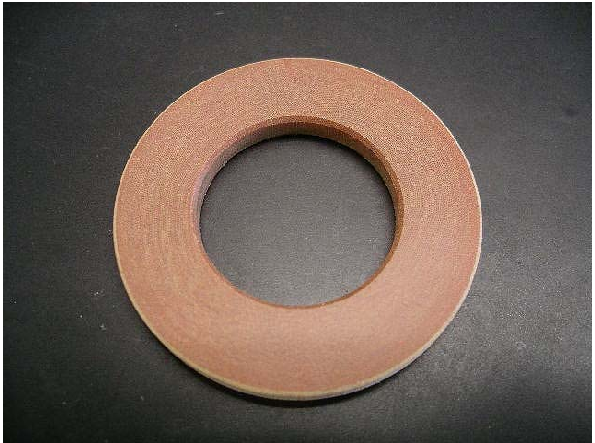
No.4584 材質:布入りパッキン 外径:45 全長:4 処理:生地