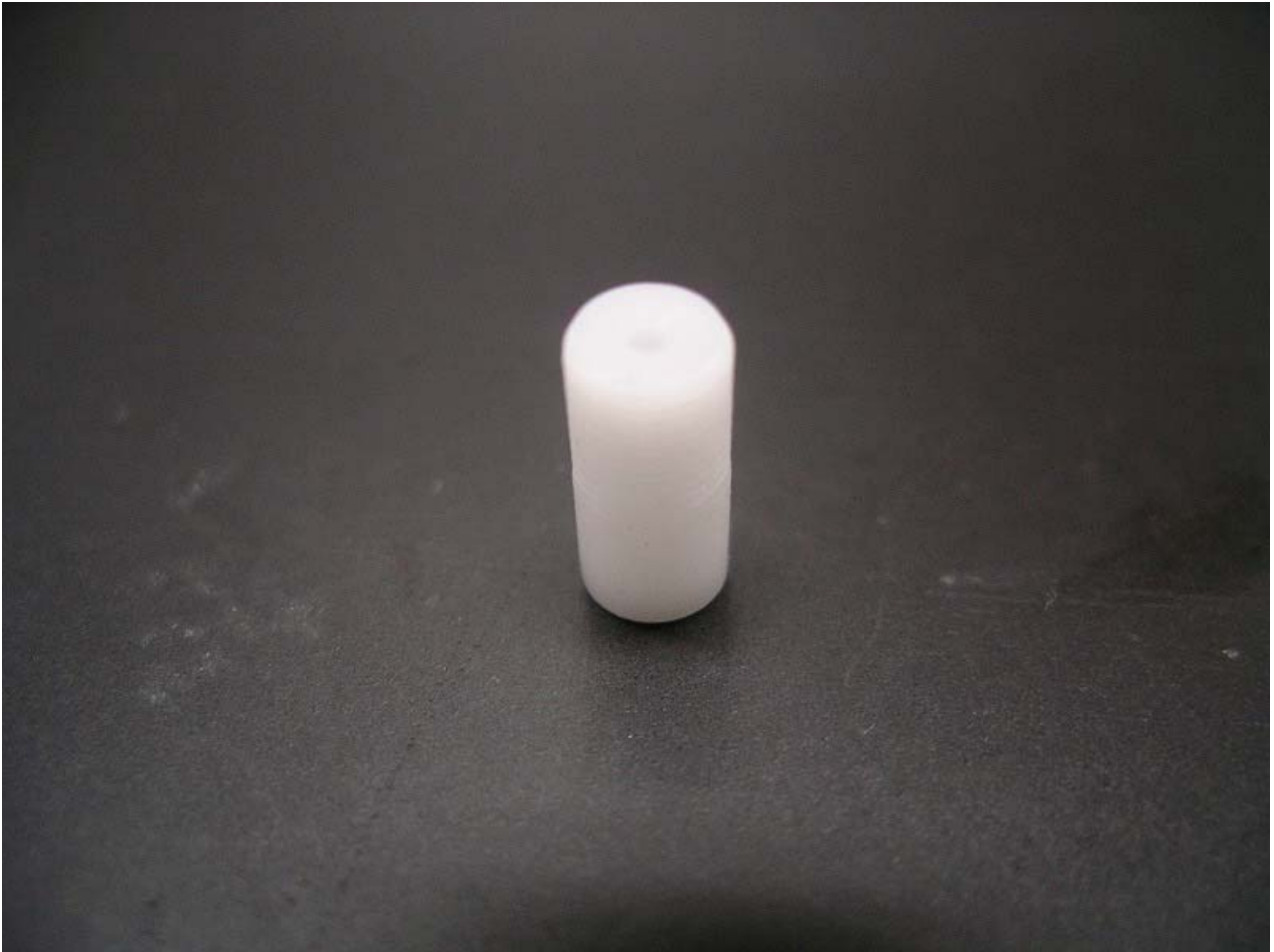
No. 17102 材質: シェラコ 外径: 5 全長: 10.5 処理: 生地