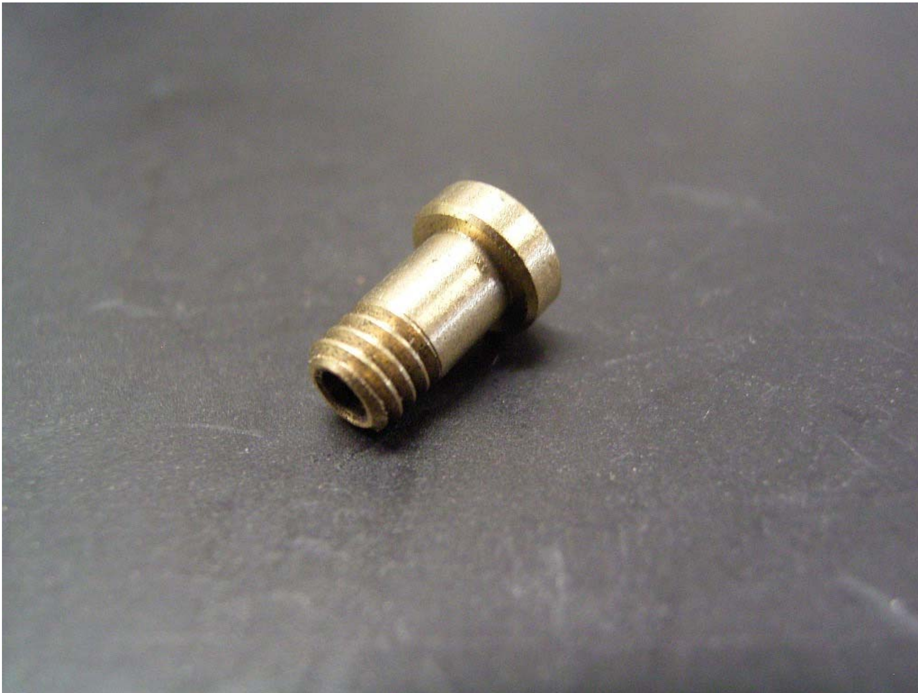
No.6375 材質:オйлサーメット 外径: 全長:14 処理:生地