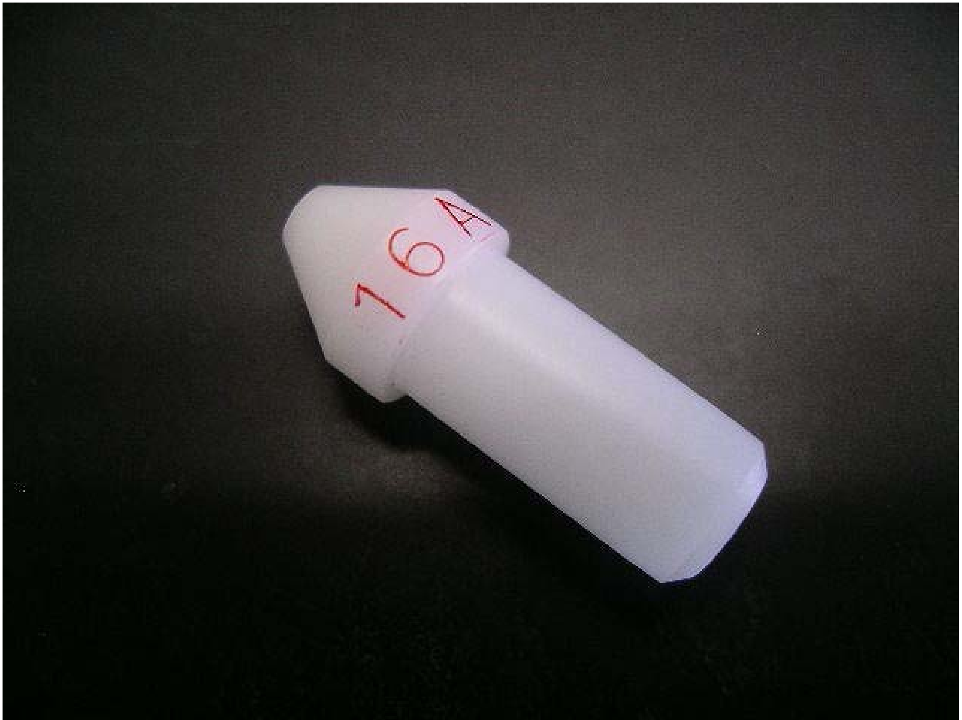
No.4979 材質:ジュラコン 外径:10 全長:25 処理:生地