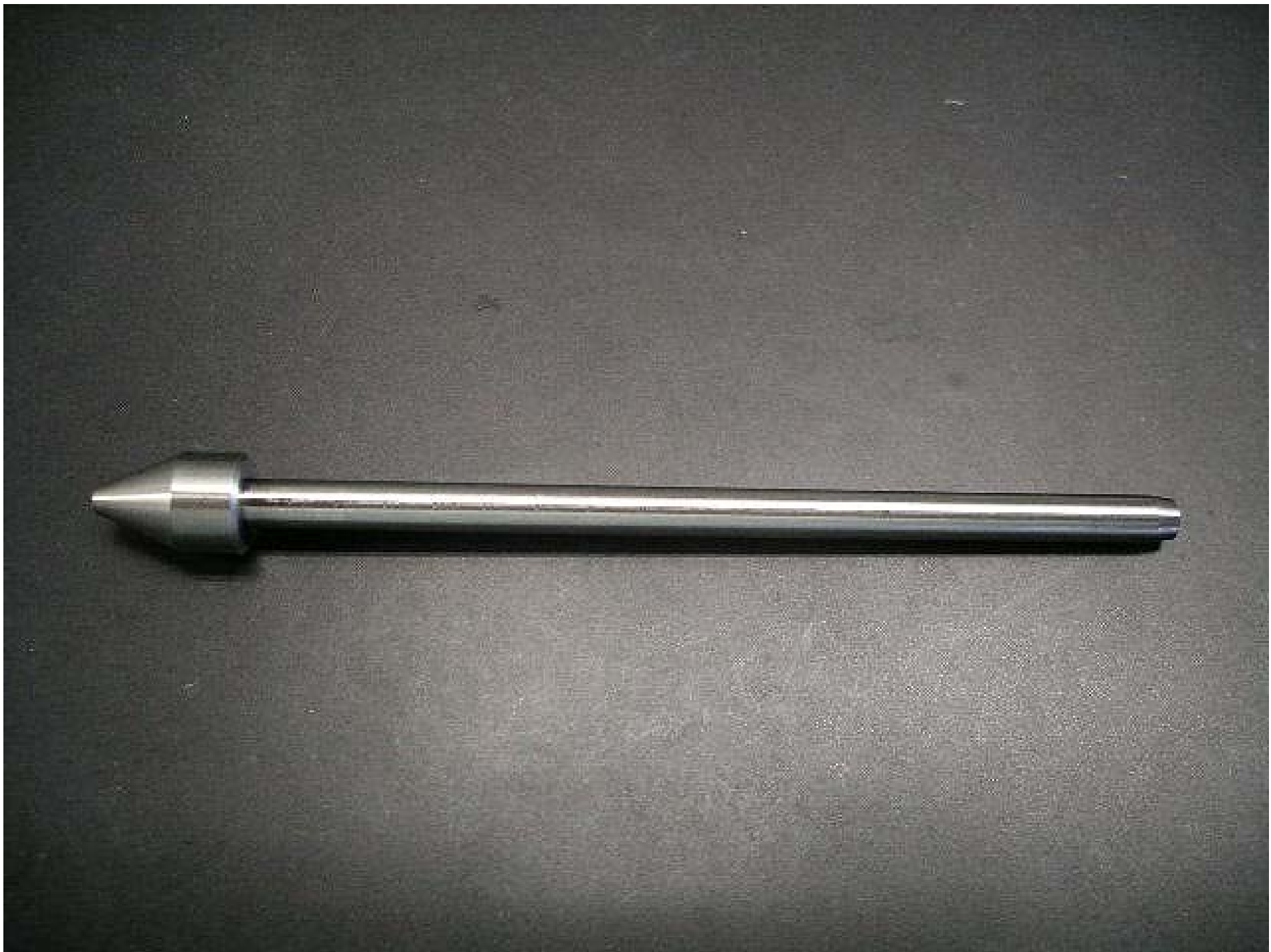
No.4891 材質:組立品 外径:8 全長:86.5 処理:生地