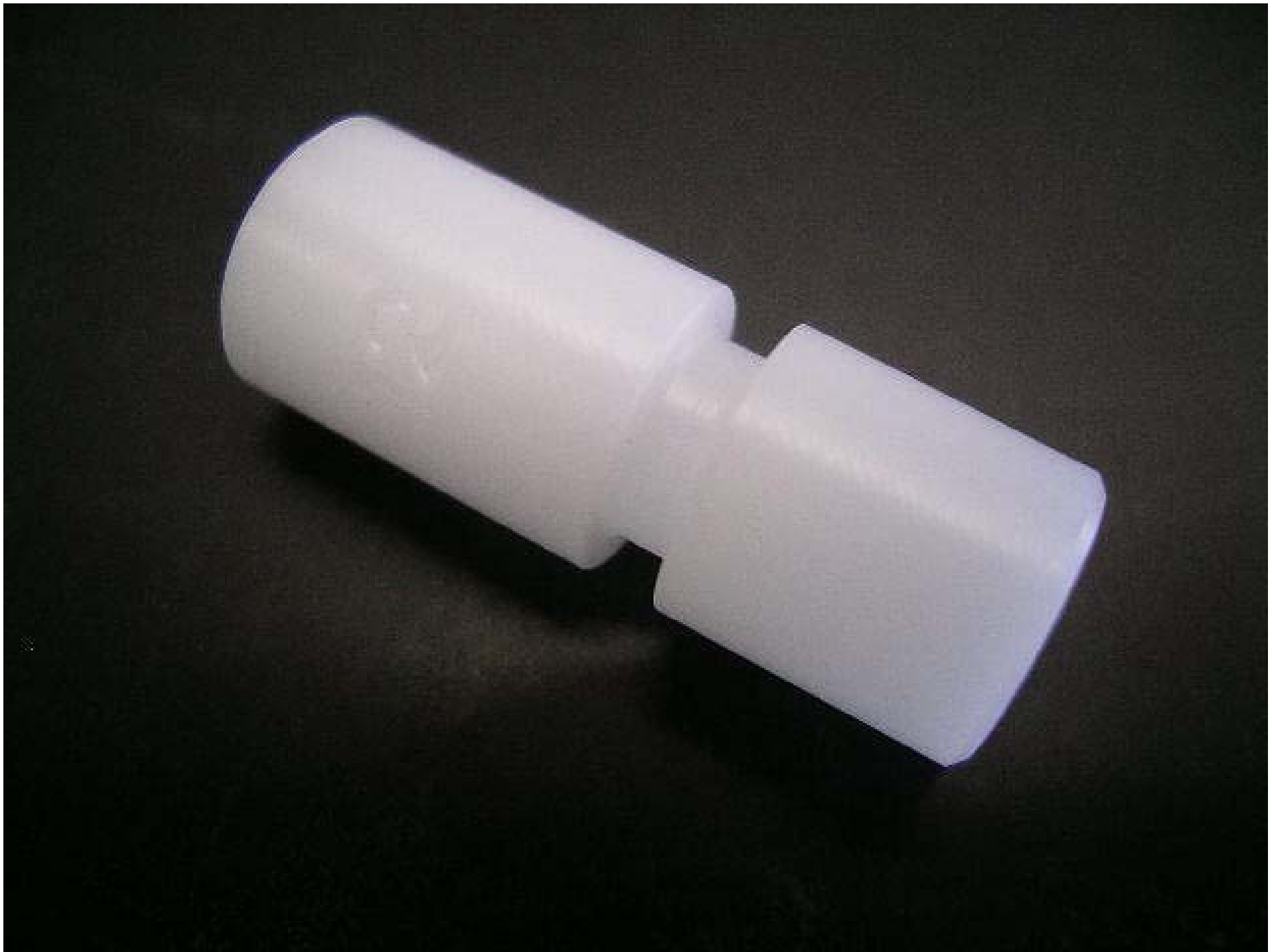
No.9240 材質:ジルコン 外径:10 全長:27 処理:生地