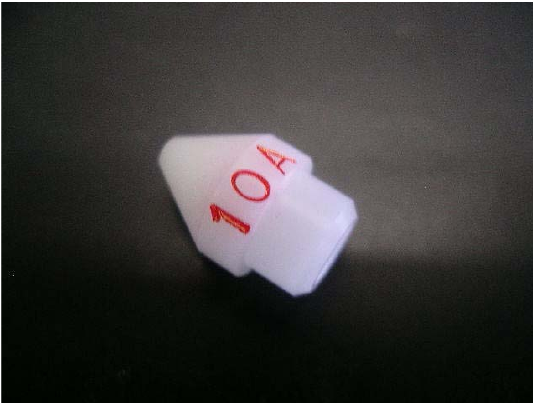
No.4947 材質:ジュラコン 外径:10 全長:15 処理:生地