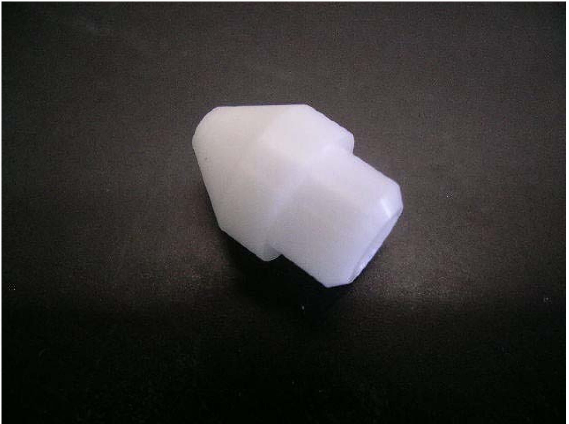
No.4934 材質:ジルコン 外径:15 全長:14 処理:生地