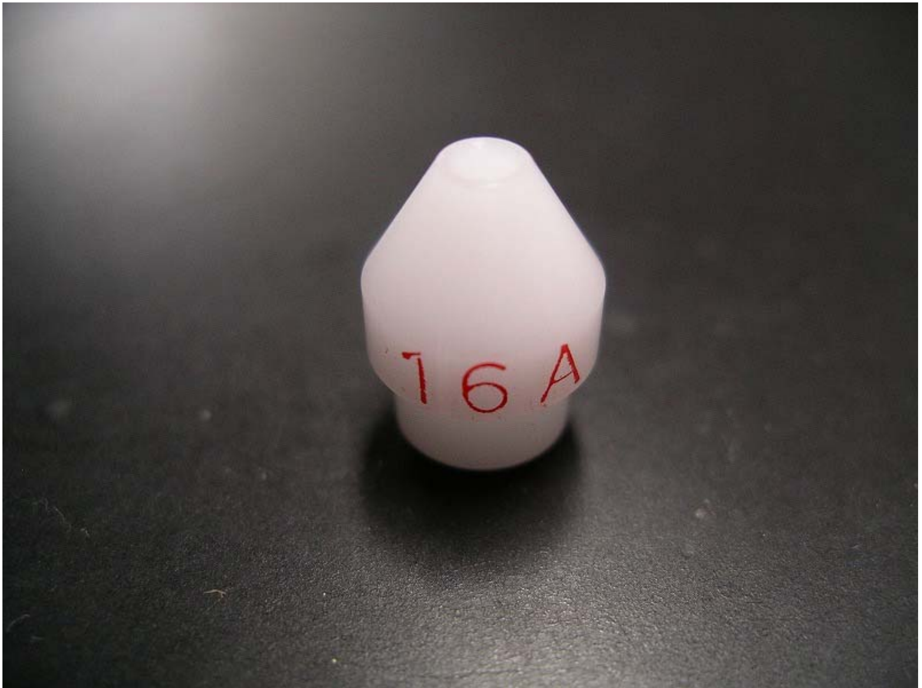
No. 4948-02 材質: ジュロン 外径: \phi 10 全長: 14.0 処理: 生地