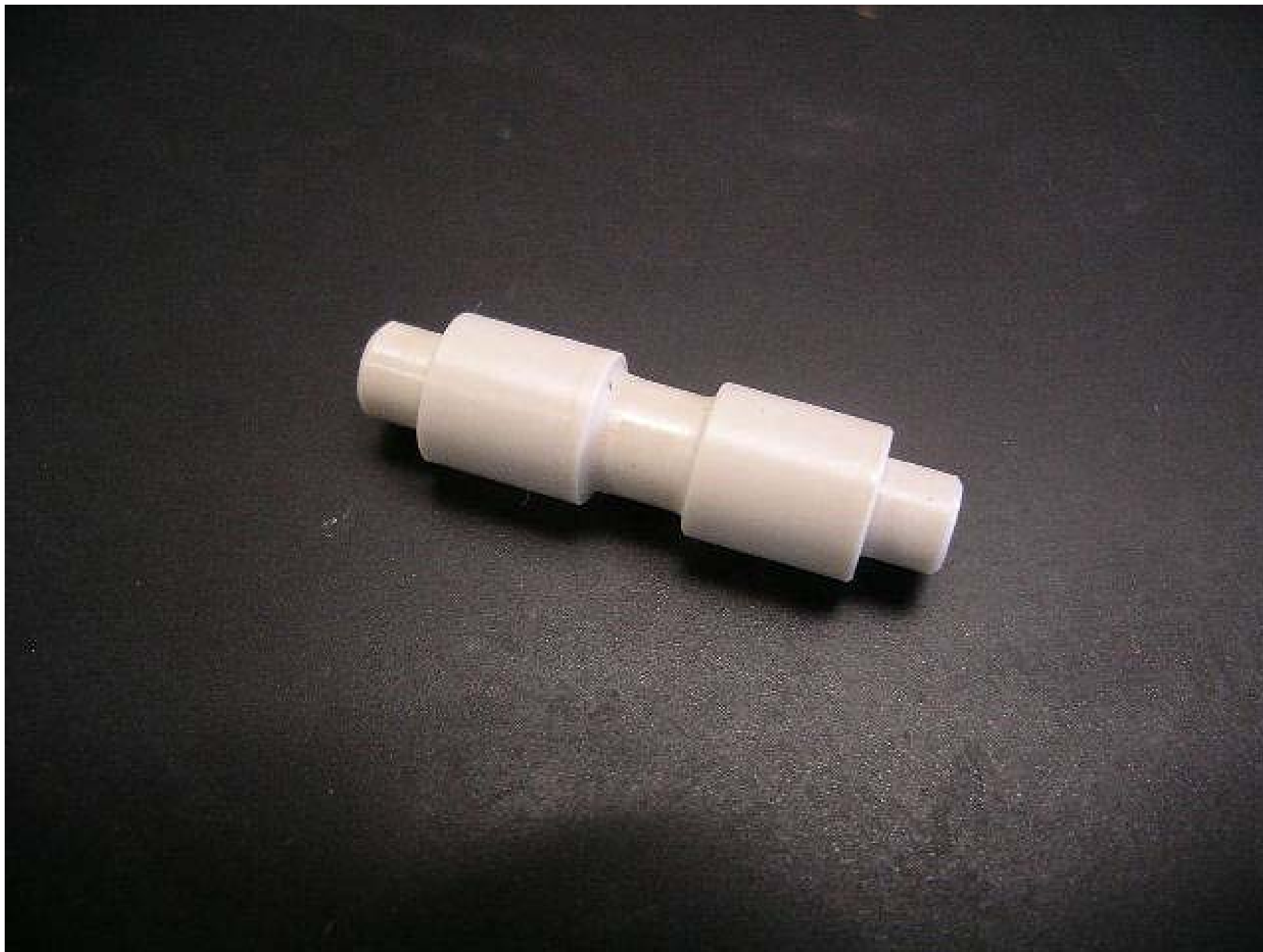
No.4736 材質:PPS 外径:10 全長:23 処理:生地