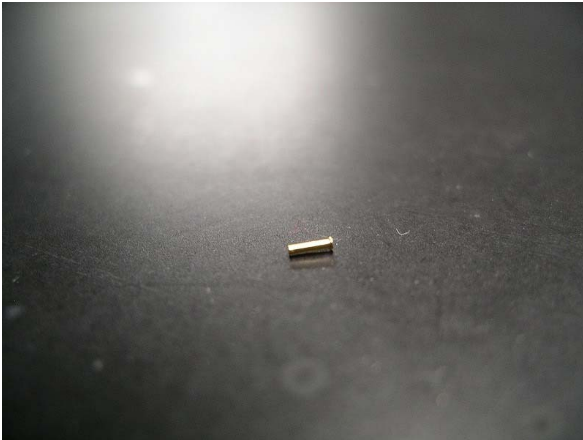
No. 7135 材質: PbPBB 外径: \phi 0.8 全長: 2.5 処理: Ni+Au