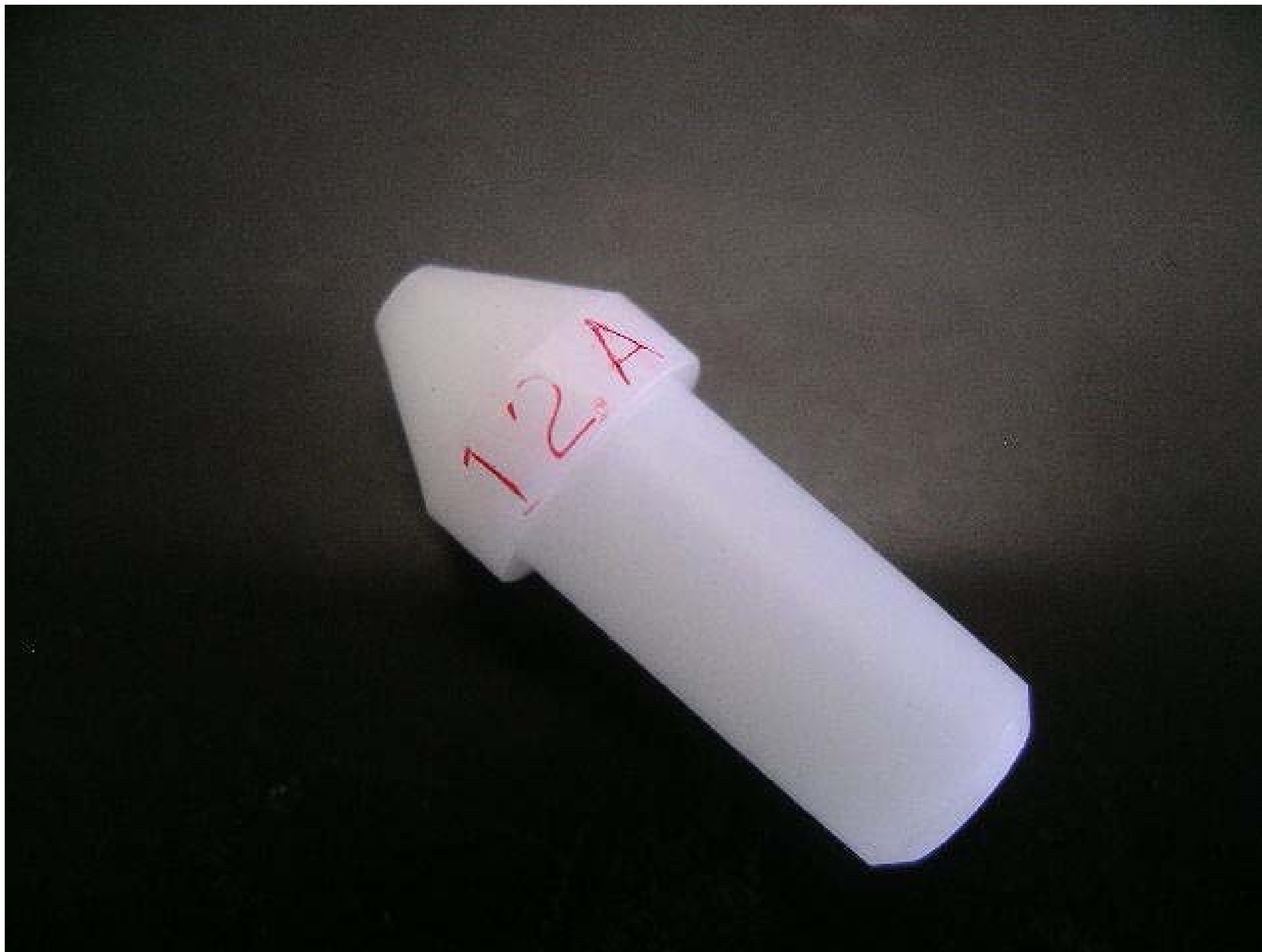
No.4978 材質:ジルコン 外径:10 全長:25.5 処理:生地