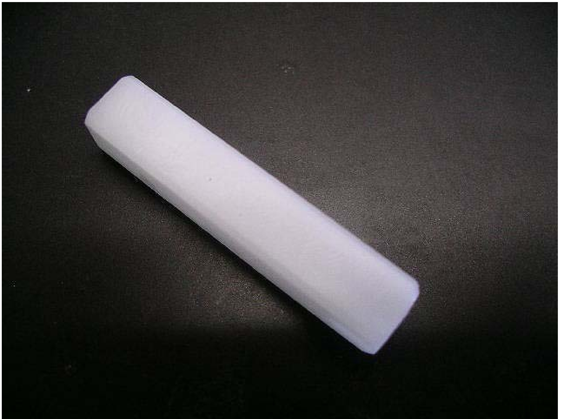
No.9208 材質:ジルコニウム 外径:10 全長:36 処理:生地