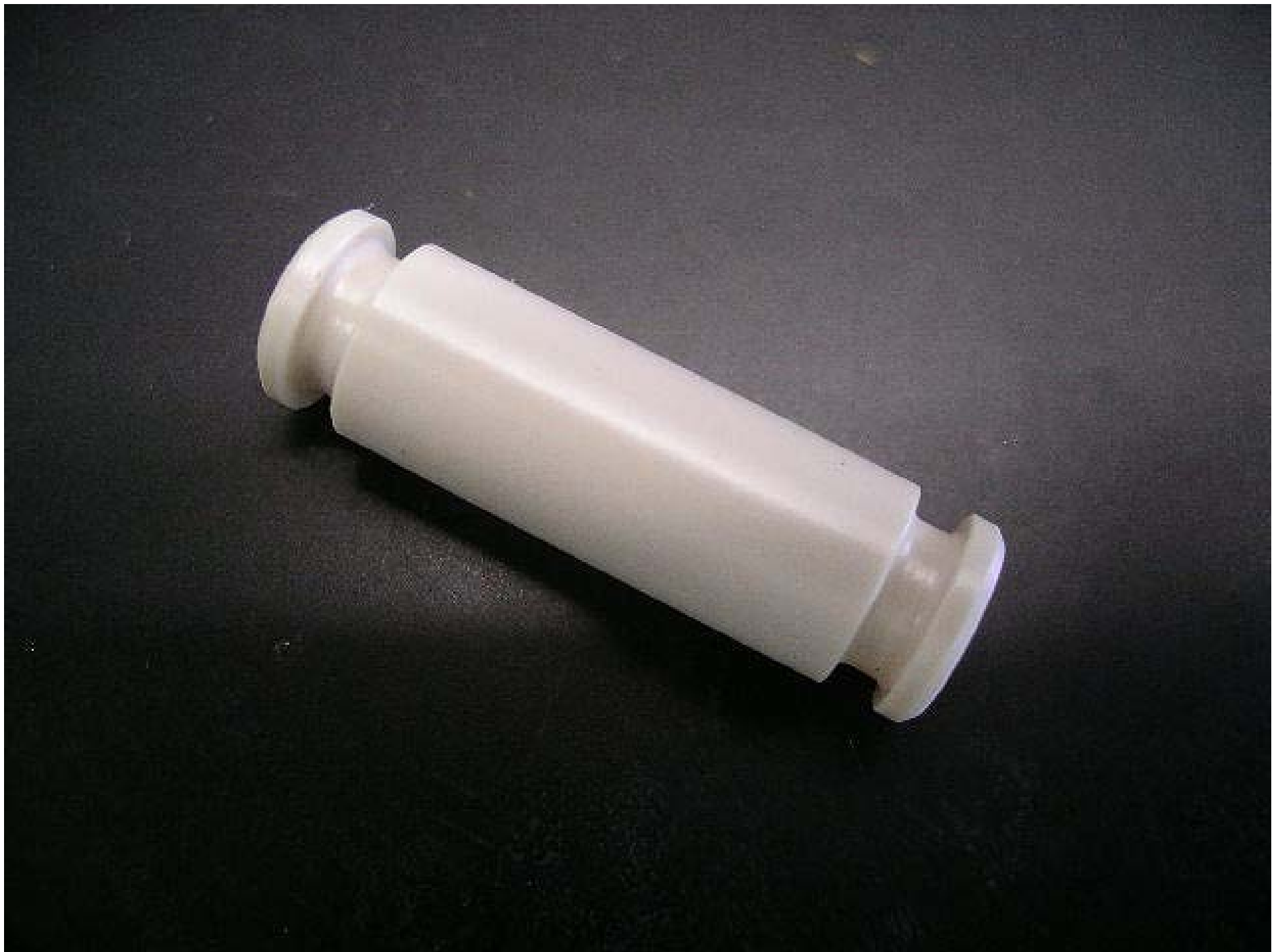
No.4945 材質:PPS 外径:10 全長:28 処理:生地