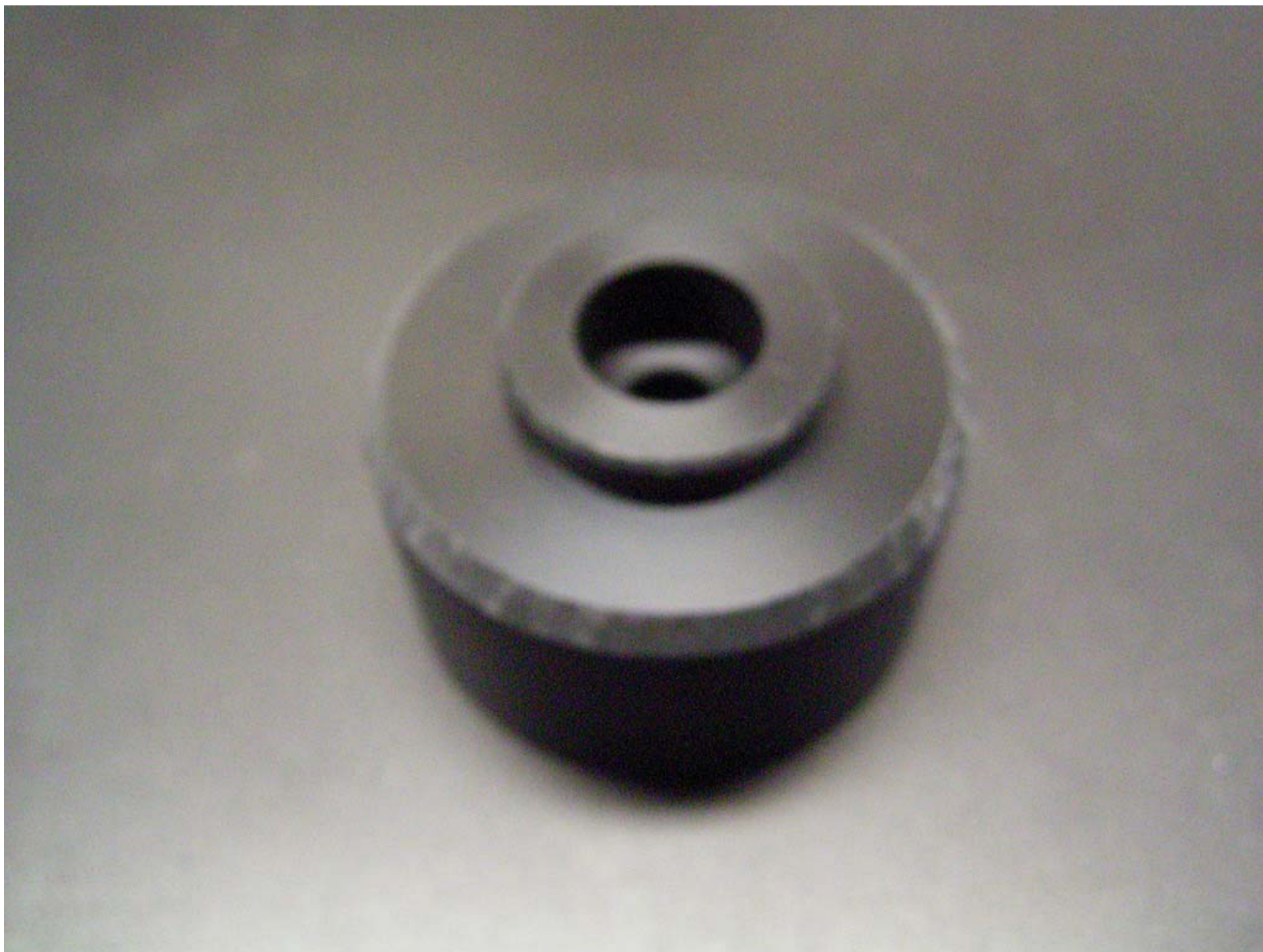
No.6173 材質:ジルコニウム 外径:35 全長:20 処理:生地