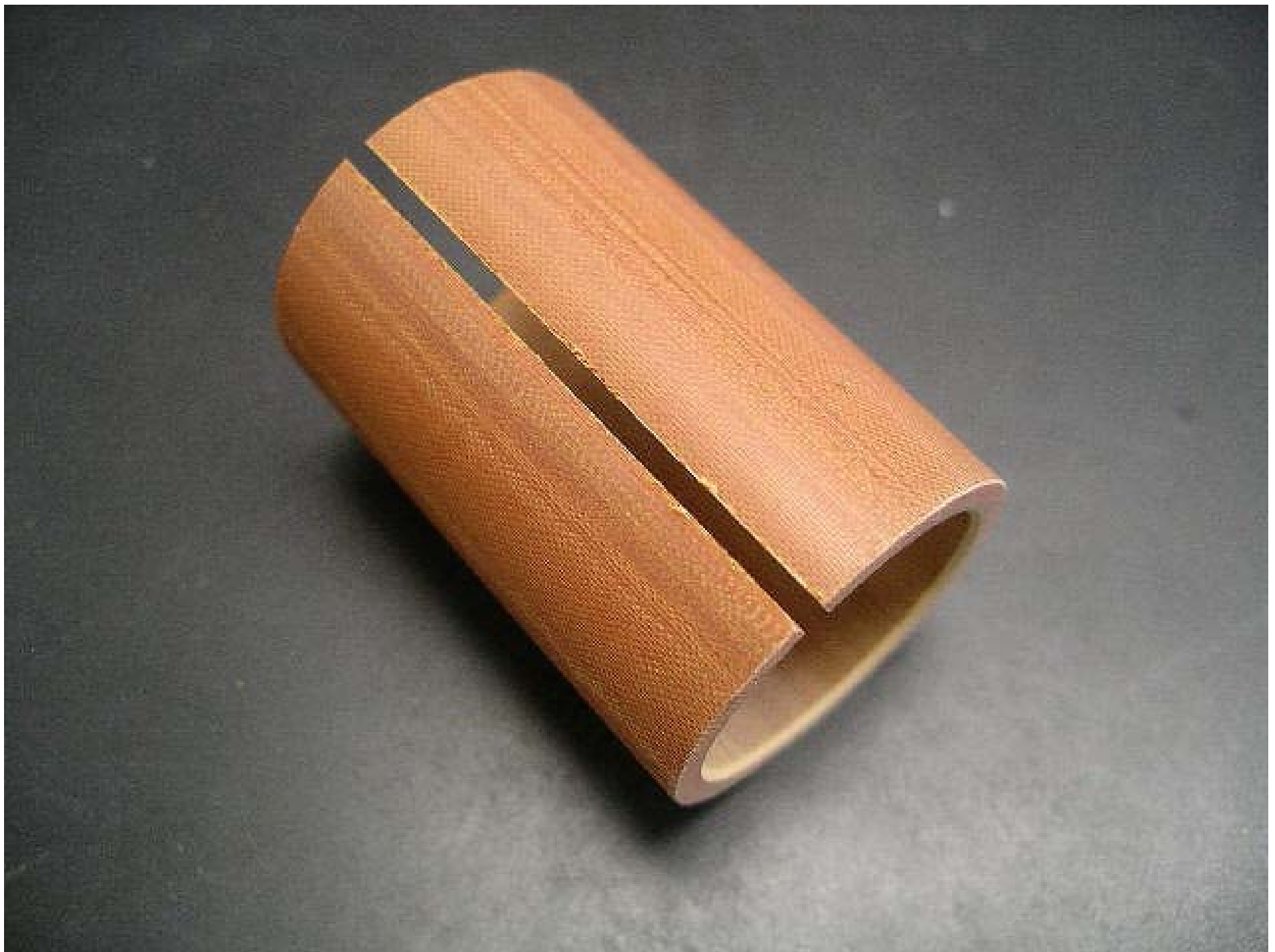
No.4585 材質:布入りパーク 外径:30 全長:45 処理:生地